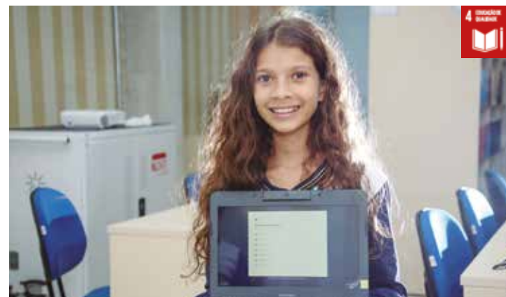
Mais de 11 mil notebooks estarão a disposição dos alunos na rede municipal de Santana de Parnaíba

Com objetivo de proporcionar um ensino cada vez com mais qualidade, Santana de Parnaíba tem investido fortemente nos últimos anos na educação e na tecnologia nas escolas. Na manhã desta quinta-feira (02/11), a prefeitura por meio da secretaria da Educação, realizou, no Colégio Ana Aparecida, no bairro São Pedro, a entrega de 5.000 notebooks a serem utilizados pelos alunos da rede de ensino e a té o início do ano que vem, serão 11 mil aparelhos, já que outros 5.500 já foram adquiridos e devem ser entregues no início das aulas.