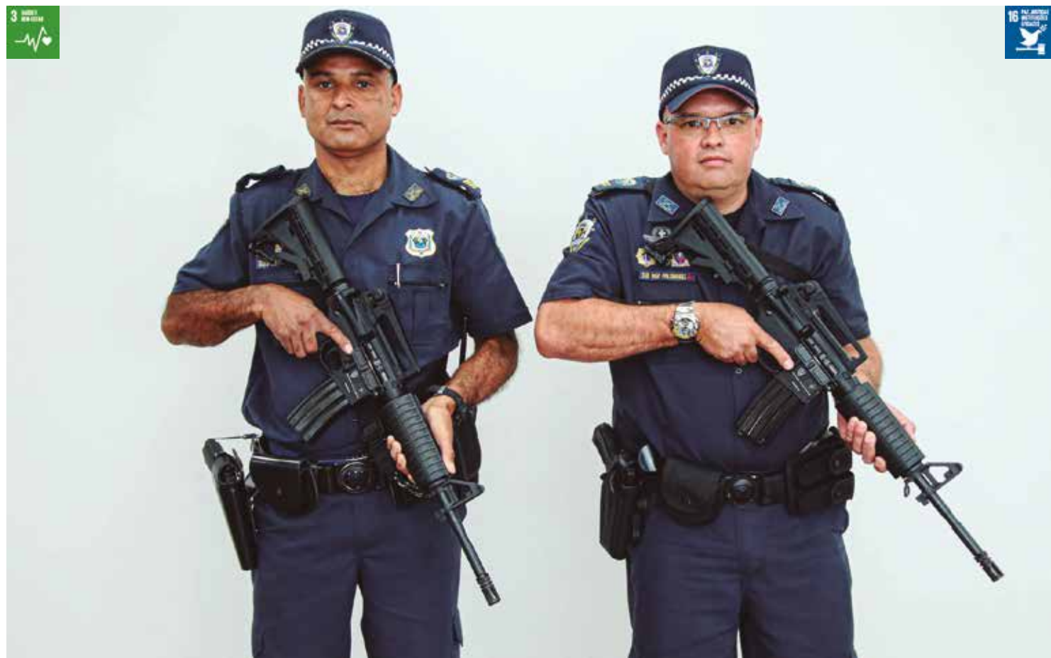
O armamento de alto poder de fogo e é utilizado pelos mais poderosos exércitos do mundo.

Santana de Parnaíba ganhou um reforço de peso para o combate à criminalidade, pois nesta quinta-feira (02/12). Chegaram os fuzis 556, que serão utilizados pelo GCM no dia a dia de trabalho de manutenção da segurança na cidade.