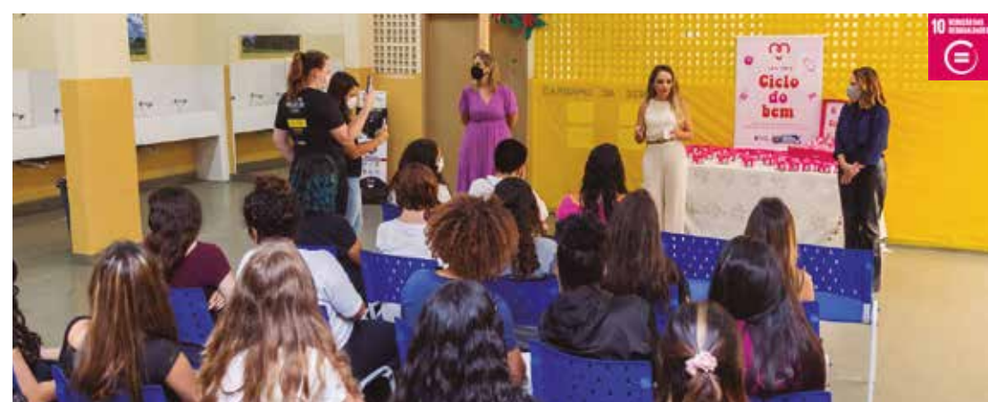
Para receber os absorventes higiênicos é necessário estar homologada no município, com a matrícula nos colégios da rede municipal e ter cadastro nos CRAS e NAS

Ao todo, serão entregues cerca de 5 mil absorventes por mês para adolescentes cadastradas nos CRAS e NAS da cidade, além disso, os protetores