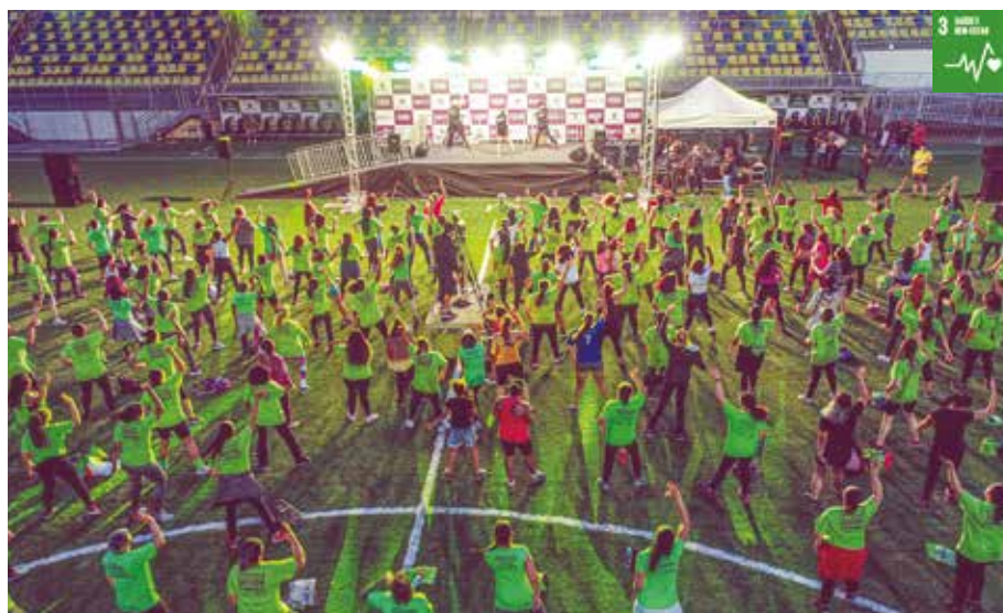
O Parnaíba Mais Leve já impactou a vida de milhares de famílias da cidade

Nesta quinta-feira (02/12), a Secretaria da Mulher e da Família realizou, no Estádio Municipal, um megaevento para marcar o encerramento da 4.ª edição do Parnaíba Mais Leve.